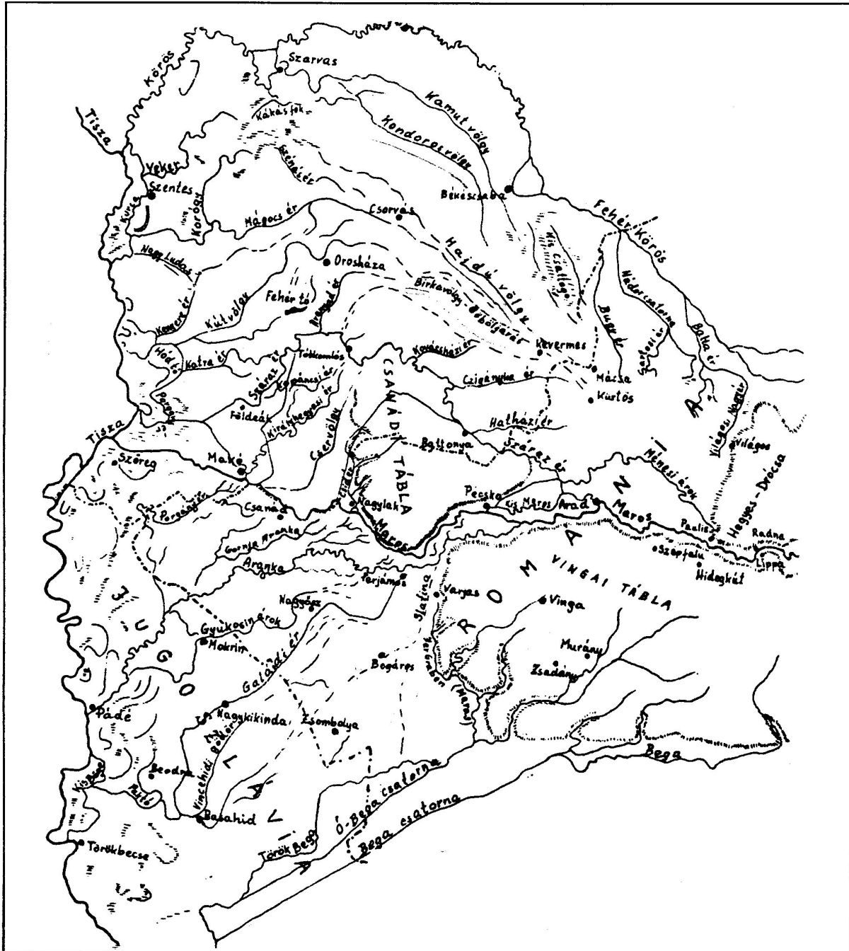
1. ábra A Maros régi vízfolyásai és elhagyott folyómedrei

Ehhez felhasználnék egy térkép vázlatot, a Maros folyó vízfolyásairól és elhagyott medreiről.